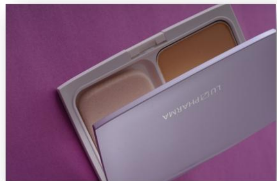
コンパクトは光沢感のあるピンク色

プレスタイプは普通のパウダーファンデーションのように、手軽に使えるのが大きな魅力。粉が飛ぶこともなく、使う場所を選びません。朝の通勤前や外出先でのお直しなどあらゆるシーンで便利に使い、“時短メイク”につながります。ミネラルファンデーション発売から2年。トゥヴェールがターゲット層と考える、仕事や育児に忙しい世代(20代～40代)のニーズによりマッチしたプレスタイプが、満を持して登場です。