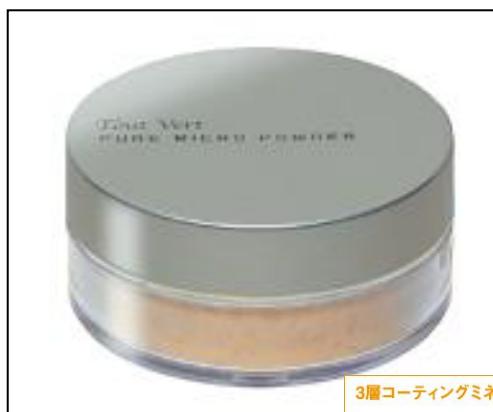
3層コーティングミネラル

リニューアルしたミネラルファンデーションは、同製品として世界で初めて、酸化チタンをすべて1 \mu の大粒子のみで構成。通常サイズと比較して400倍の大粒子が紫外線だけでなく、赤外線もカットして急激な皮膚温度上昇による発汗を防止し、化粧持ちを良くすることに成功しました。さらにオイル成分、ヒアルロン酸でミネラルを3重にコーティングすることにより、乾燥しがちなミネラルの欠点を克服し、保湿感の両立も実現。またビタミンC誘導体4種にセラミド2種、アミノ酸4種、ヒアルロン酸2種の合計14種類のスキンケア成分を贅沢に配合し、肌への優しさを追求しました。